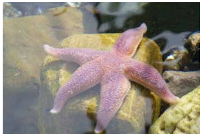
Zeelandreis: zeester