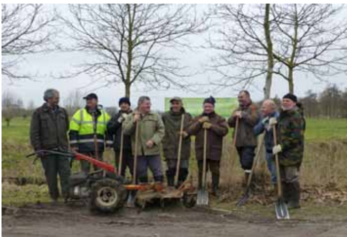
Beheerswerken Vloeiweiden